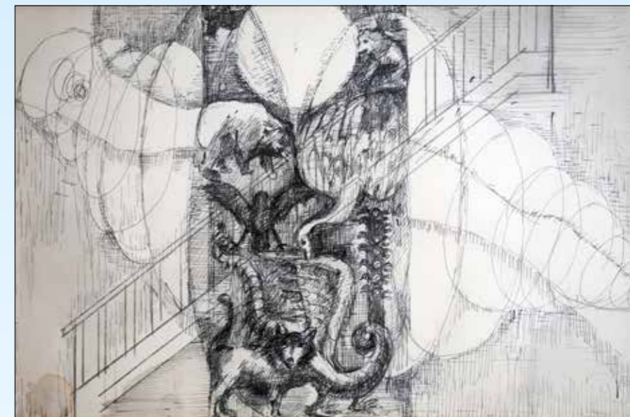
Ontwerptekening muurschildering Zuylenstede door Romualda van Stolk, ca. 1970.