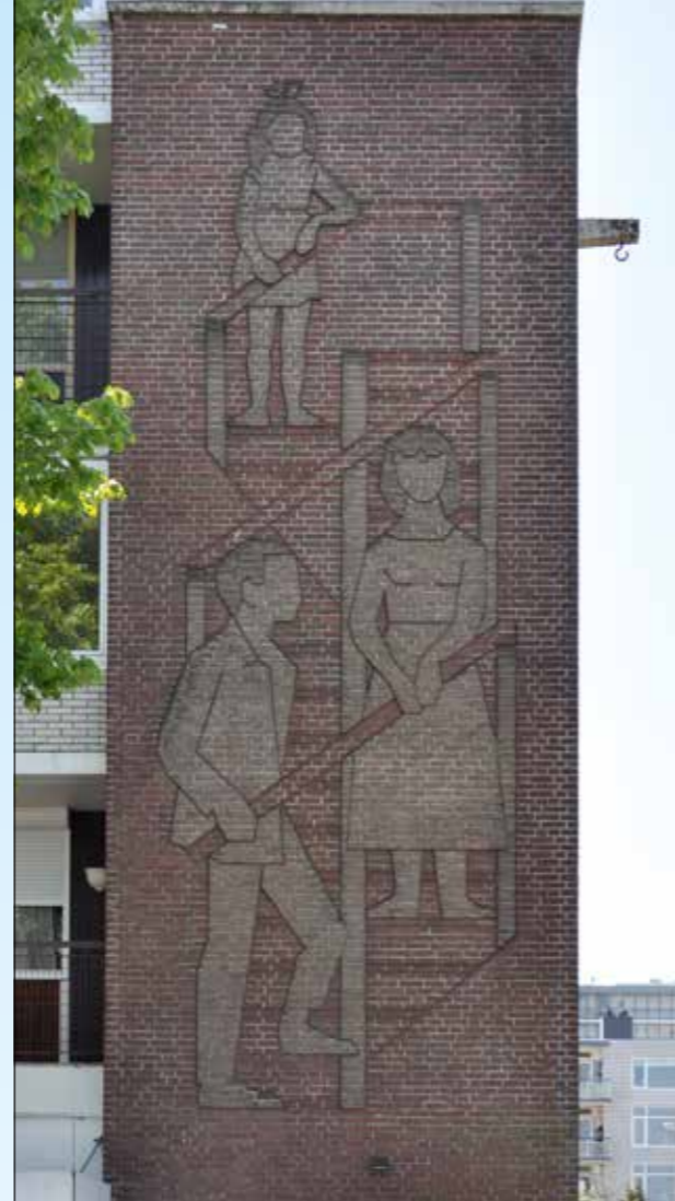
Baksteenrelief Gezin op trap uit 1961, Van Bijkershoeklaan 387 in Utrecht