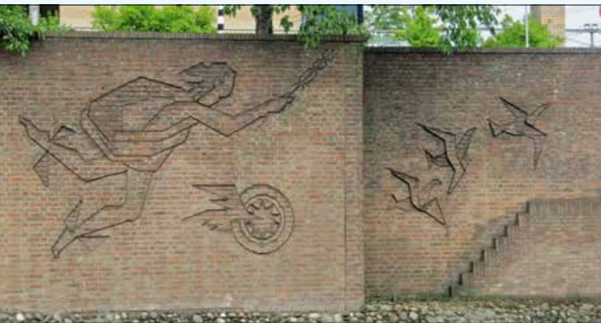
Baksteenrelief Mercurius uit 1958 aan de tunnel Amsterdamseweg/Stadsring in Amersfoort

De metselaars, die de tijdrovende klus deels onbetaald deden uit liefde voor hun vak, kwamen ook aan het woord: 'Zoiets hebben we nog nooit gemaakt en dat zal ook wel niet meer voorkomen.' Het kunstwerk toonde vier kleermaaksters achter naaimachines. Bij de sloop van de school in de jaren negentig ging dit reliëf verloren.