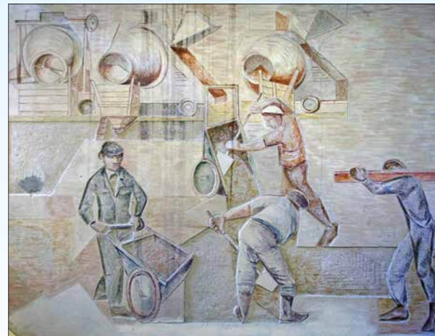
Detail fresco-reliëf Bouwlieden uit 1965, kantoor Ramstraat 37 in Utrecht

Ook Van Overhagens bouwwerken werden grootschaliger, zoals de 250 meter lange flat aan de Tannhäuserdreef