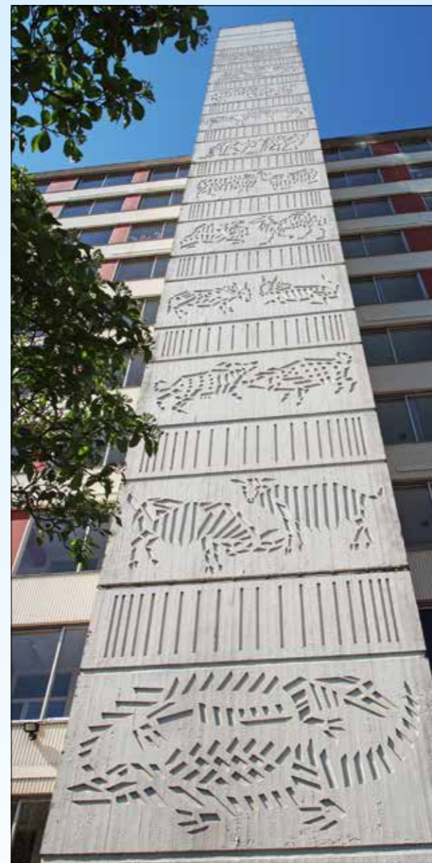
Betonreliëfs Dierparen uit 1970 aan liftkoker woonzorgcentrum Zuylenstede, Perudreef 8 in Utrecht