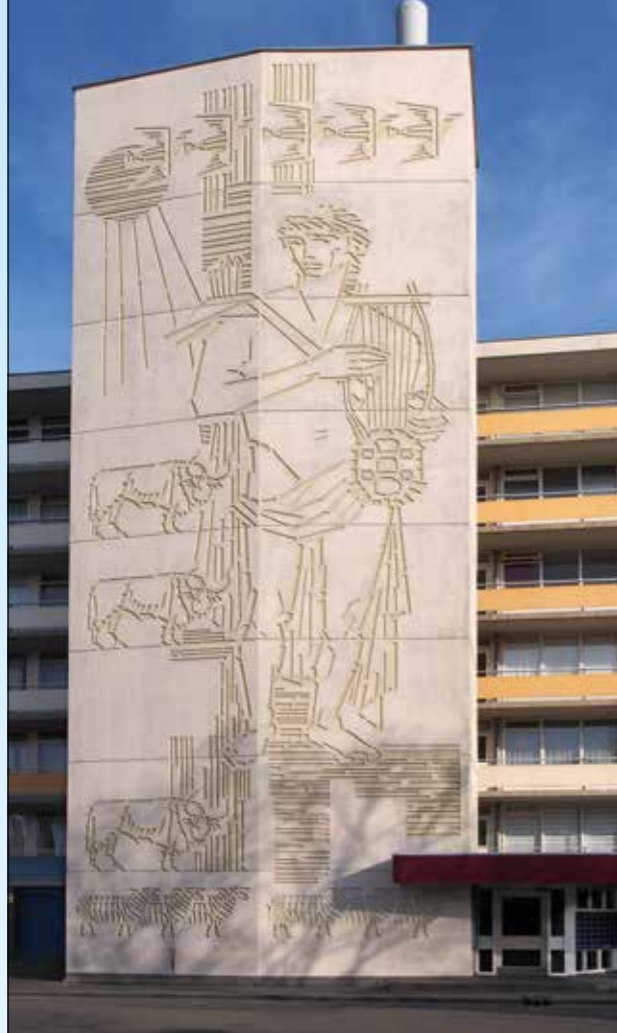
Betonrelief Apollo uit 1965, flat Tannhäuserdreef in Utrecht