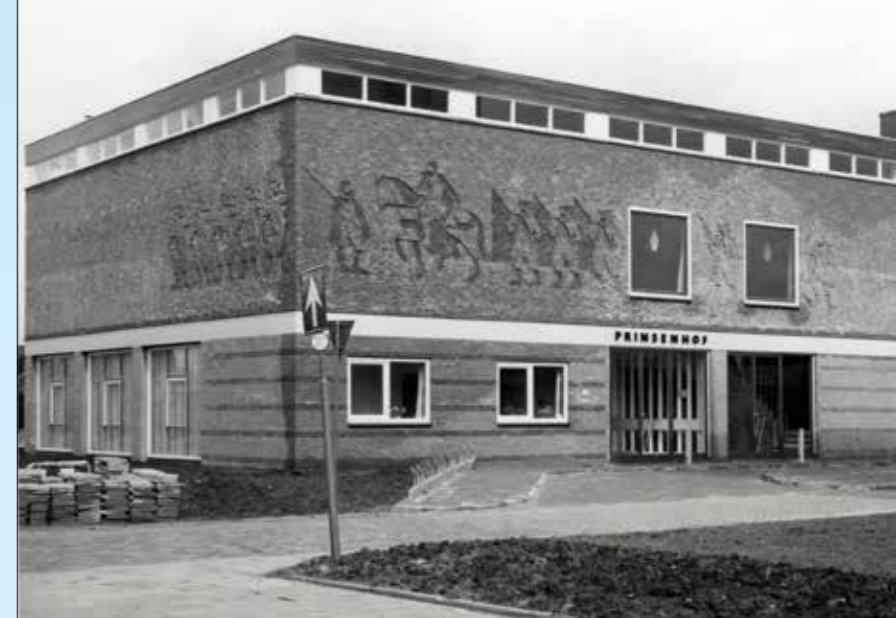
Baksteenrelief De Prinsemarij uit 1962 aan wijkcentrum Prinsenhof, Eykmanlaan 431 in Utrecht